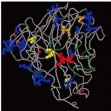
图1 甲型H1N1流感病毒3D模型。红点代表药物及其它原子，蓝点代表甲型H1N1病毒相比1918年流感病毒新出现的变异点，黄点代表甲型H1N1流感出现在不同病例中的变异点，橙点代表只在一个甲型H1N1流感病例中出现的变异点。甲型H1N1流感病毒表面密布着两种蛋白质——血细胞凝集素（HA）和神经氨酸酶（NA）。针对神经氨酸酶开发的流感药物——达菲和乐感清对治疗目前的甲型H1N1流感病毒有一定疗效。

全 球性甲型H1N1流感来袭令疫苗这一人类预防疾病最有效的武器愈发受到关注（图1、2）。疫苗这一概念是200年前由英国医生Edward Jenner首先提出的。近代免疫学奠基人Pasteur发明了第一种鸡细菌减毒霍乱疫苗，并提出了为动物接种相同的细菌可以阻止该菌感染的免疫接种原理，从而奠定了免疫理论基础。1949年，Enders发明了组织培养技术，为病毒类疫苗的研究与发明开辟了新的途径。疫苗学（vaccinology）从作坊式的实验室学科发展成了今天的集免疫学、微生物学、生物化学、分子生物学、生物工程学、流行病学、临床医学和卫生经济学等于一体，采用尖端技术及其最新研究成果的综合性学科。